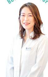
教えてくれるのは