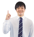
編集部：やっちゃん